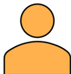
Patient- och närståendeföreträdare

”Det är roligt och lärorikt att jag kan påverka min och andra patienters vårdssituation. Man lyssnar på mig och mina erfarenheter, jag känner att vi gör skillnad.”